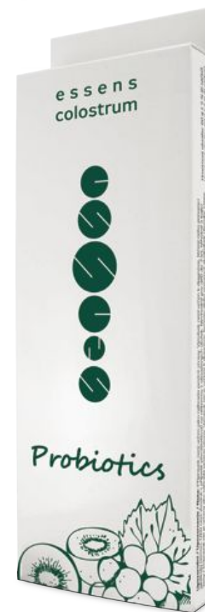
Kolostrum probiotiki | 19,20€