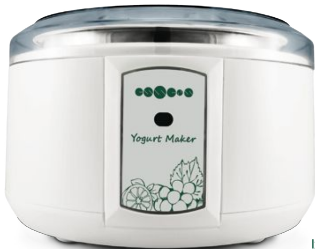
Izdelovalec jogurta | 34,20€

Priročnik v vašem jeziku je vključen v paket.