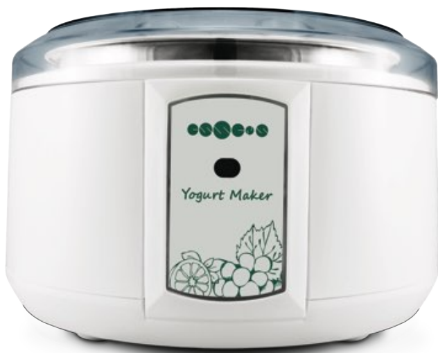
Maquina de yogur | 33,60 €

Peso: 0,91kg (envasado Peso 1,05 kg) Manual en su idioma está incluido en el paquete.