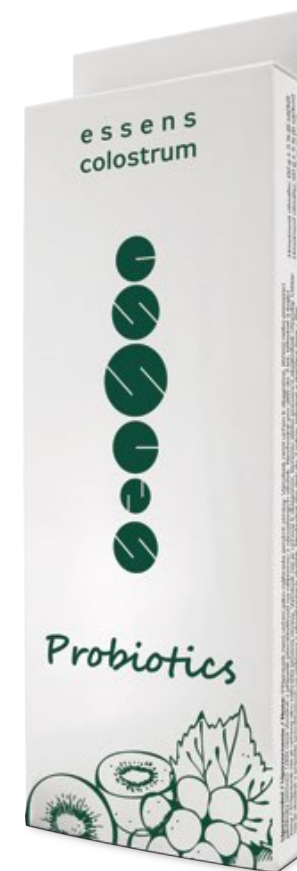
Calostro Probióticos | 21,00 €