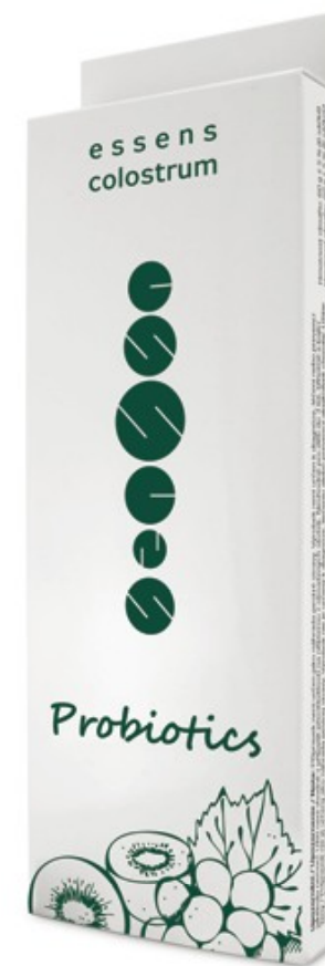
Пробиотици с Colostrum | 42 лв.

Съдържание на опаковката: 6 пакетчета / 10 гр. смес в пакетче