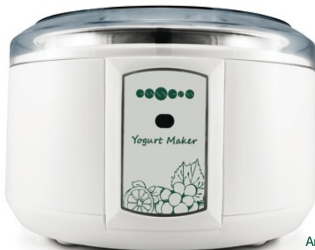
Апарат за кисело мляко | 67,20 лв.

Тегло: 0,91кг. (опаковка 1.05 кг) Комплекта включва указание за употреба.